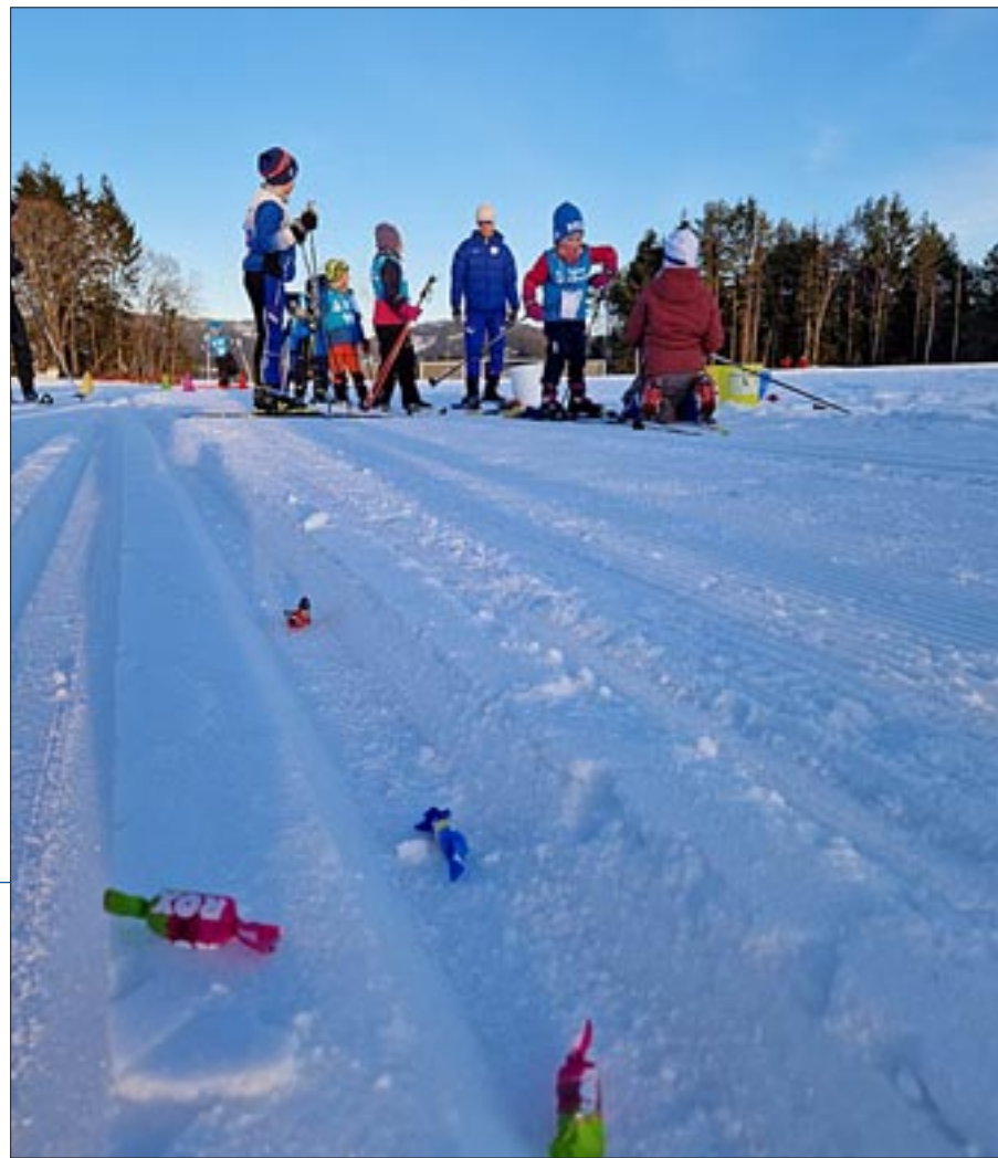
Klubbrenn med ballkast og godterifangst i løypa