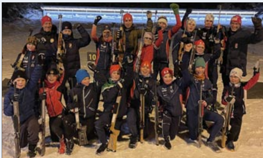
En del av Skatval skilags skiskytterfamilie i Klempen, desember 2023.

sporten og se hva dette var for noe. Og siden har jeg ikke klart å slutte.