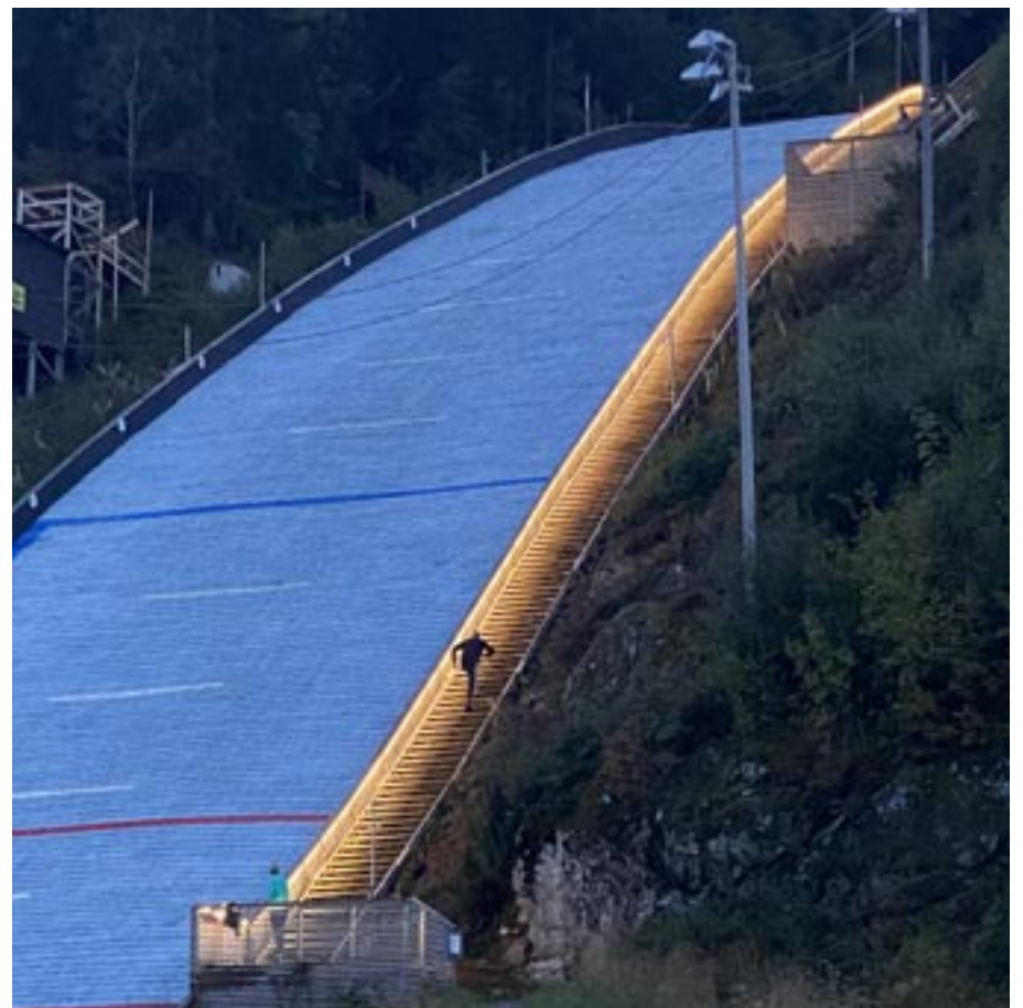
Trimtrappen opplyst i blåtimen.

INTERSPORT® STOLT SPONSOR AV SKATVAL SKILAG